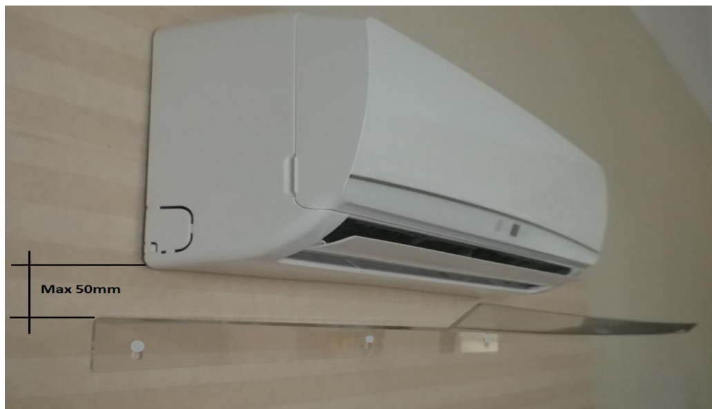
DEFLETTORE ARIA PER UNITA' INTERNA

trapano con punta da muro Diam.6mm, bolla o livella, matita , cacciavite a croce, martello .